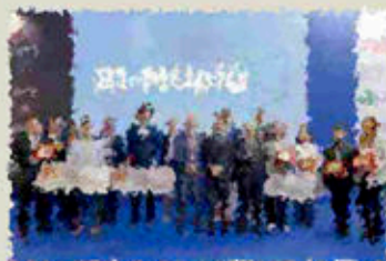
Presentazione della 34. BI-MU a Milano

Senza le loro preziose collaborazioni, la 34. BI-MU non avrebbe potuto essere realizzata. È un risultato che testimonia l'impegno di tutti i partner della 34. BI-MU, che hanno lavorato insieme per realizzare un evento di successo. La 34. BI-MU è un evento che testimonia l'impegno di tutti i partner della 34. BI-MU, che hanno lavorato insieme per realizzare un evento di successo.